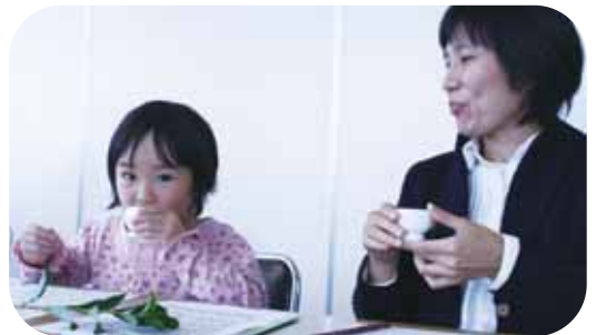
▲11月3日に親子で楽しむ宇治茶のスタンプラリーを開催。玉露・茶香服体験やクイズも取り入れました。(写真は茶香服体験の様子)

した。ふだん飲んでいるペットボトルのお茶とは全く違いました」。そこで、「この感動を皆さんにも知ってほしくて、玉露・茶香服体験もすることに。素人の私たちだからその企画なのかもしれませんが」。この企画の大きな特徴は、茶業関係者、商店街、観光協会、行政、NPOなどが協力していることです。「(地域の)人との繋がりができたことがうれしい。多くの人に協力してもらっているのだから、一生懸命がんばりました」。そして、「来年も続けていければと。企画段階からお茶屋さんや学生と一緒に考えて宇治茶の魅力を発信できたら…」と、今後の抱負をしっかりと表情で語られました。