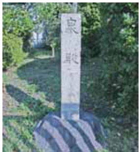
▲泉殿の碑(宇治戸ノ内)

後冷泉天皇のもとに嫁いだ藤原頼通の娘寛子(1036~1121)は、晩年を宇治の別荘で過ごした。その別荘に「泉殿」として建てられた。また、同じ頃、藤原氏の筆頭となった藤原忠実(1078~1162)も、宇治に強い思い入れを持ちました。頼通のひ孫にあたる彼はこの地に別荘や莊園を営み、よく宇治を訪れたといわれています。 忠実自身や彼が営んだ別荘や周辺の莊園を指して「富家殿」ということがあり、その範囲と邸宅の所在地は、宇治・榎島と対岸の五ヶ庄を含めた一帯のどこかと、はつきりしません。