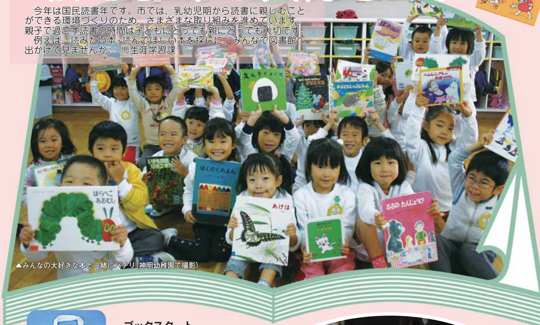
▲みんなの大好きな本と一緒にパチリ(神明幼稚園で撮影)

今年国民読書年です。市では、乳幼児期から読書に親しむことができる環境づくりのため、さまざまな取り組みを進めています。親子で過ごす読書の時間は子どもにとっても親にとっても大切です。例えば、読みたい本・読んでほしい本を探しに、みんなで図書館へ出かけて見ませんか。 園生涯学習課