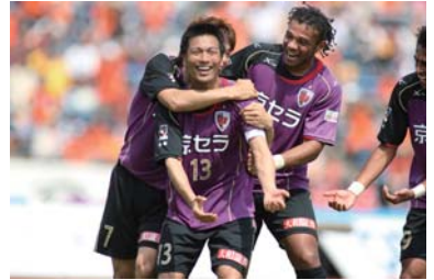
園市生涯学習課・京都サンガF.C.(☎55-7603)

用の表にも住所・氏名を書き、11月24日(水)まで(必着)に、〒610-0102城陽市久世上大谷89-1「京都サンガF.C.宇治市ご招待」係へ。