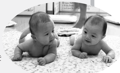
▲3か月児健康診査ではうつせ遊びなどを確認します。