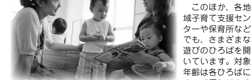
▲ゆめりあうじでの「げんきひろば」の様子。皆さんもお越しください。

に来てゆっくりおしゃべりできるひろばです。このほか、各地域子育て支援センターや保育所などでも、さまざまな遊びのひろばを開いています。対象年齢は各ひろばによって異なります。