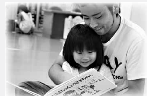
▲絵本の読み聞かせで、親子で楽しい時間を過ごしましょう。

テレビの時間は1日2時間までと決めて、視力と体全体の成長のためにも、外で遊ぶ時間を大切にしてください。