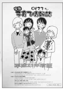
図 地域子育て支援基幹センター (☎ 39-9109)

子育てに役立つ情報が満載の情報誌です。市の子育て支援施策のほか、幼稚園・保育所・団体等が行う関連事業や、子育てサークルの情報を詳しく紹介しています。また、子育てに関する各種手当、保健医療制度の案内や、いざというときの相談窓口も掲載しています。市役所・市内の各地域子育て支援センター・公民館・図書館・地域福祉センターなどの市の主な公共施設や商業施設などで配布しているほか、市ホームページ ( http://www.city.uji.kyoto.jp/ ) でも閲覧できます。また、各種健康診査や母子手帳GET(ゲット)記念日などでも配布していますので、ぜひご利用ください。