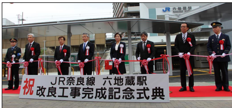
< J R 奈良線 六地蔵駅記念式典 >