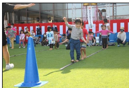
<西宇治公園 芝生ひろばオープニングイベント>