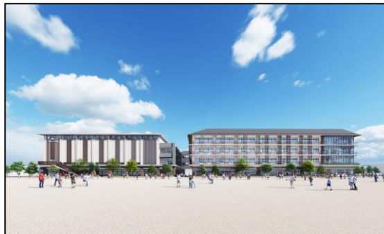
< (仮) 西小倉地域小中一貫校完成イメージ >