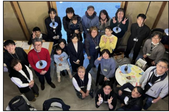
<まちのリビングによるつながり>