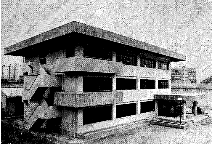
完成した水道部新庁舎

発行 宇治市 編集 文書広報課 宇治市宇治路33番地 電話 23141(代) ●毎月1日・11日・21日発行