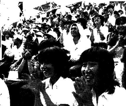
▶熱い拍手と歓声にわく宇治高応援席

市街区域農地に対する固定資産税(都市計画の宅地並み課税)は、これまで旧A・B農地のみに限定して実施されてきました。しかし、今回地方税法改正により、都市計画法改正により、新たな三三三方式(当市面積が三三三以上の旧農地については課税対象に引き込まれます)。