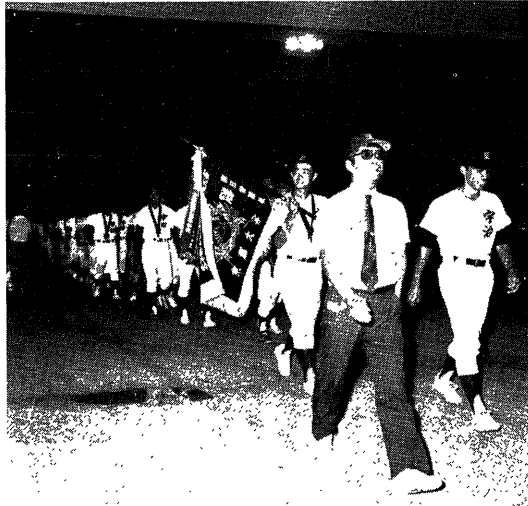
▲優勝祝賀会場へ行進する宇治高ナイン

「あつたなを高く、甲子園 せいに凱歌があがる。 だ一星側スタンドからい。 七月三十日、第六四回 全国高校野球選手権京都大会の決勝戦、地学治高高校野球