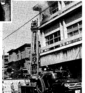
「三階から出火！」一秒を争う避難訓練 (二月、静山荘で)