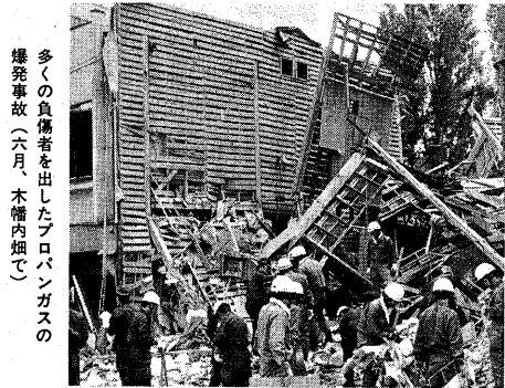
多くの負傷者を出したプロパンガスの爆発事故 (六月、木幡内畑で)