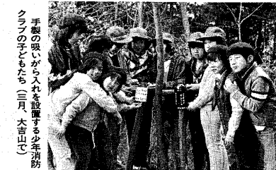
みんなて防火に努めましょう