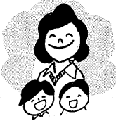
お母さんの勉強室日程表