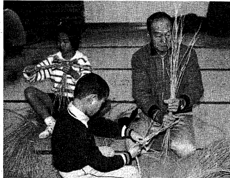
▶仲良くしめなわづくり(昨年12月26日、小倉公民館)

今年も残すところ半月余り。皆さんのご家庭は、今年一年間いかがでしたか。新たな気持ちで迎える新年には、手づくりの品を添えてみましょう。木幡公民館と小倉公民館では、新年を迎える準備に役立てていただくこと、迎春準備講習会を開催します。子どもたちを対象としたジュニア教室も、今回は迎春準備です。家族で手分けして準備してみませんか。ぜひご参加ください。