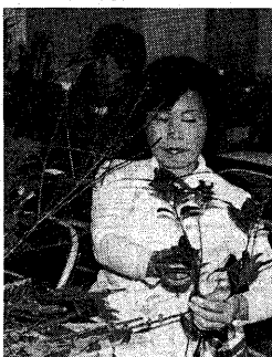
▲正月用の花を生ける表情は真剣(昨年12月27日、木幡公民館)

迎春準備講習会 ▶とき：12月26日(金) 午後1時半～3時 ▶ところ：小倉公民館(指導：しめなわ輪飾り・はかまをつくり手) ▶対象：市内住の人 ▶申し込み：電話で小倉公民館へ ▶電話：0774-4637