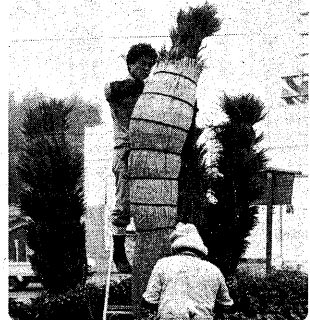
▶ゴミ巻きが行われた市役所前のソテツ(12月1日)