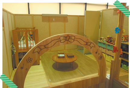
京都府産木材を使用した改修を行いました

相談スタッフ ●保育士…月～金曜日 ●専門相談員…火・木曜日 (12:00～13:00をのぞく)