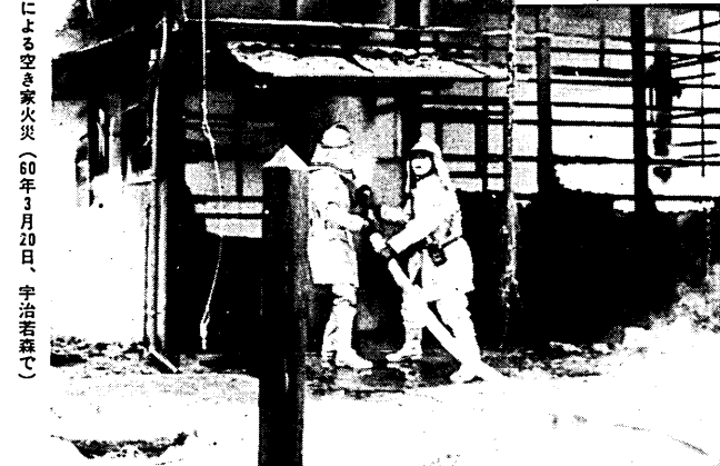
▶一連の放火による空き家火災(60年3月20日、宇治若森で)