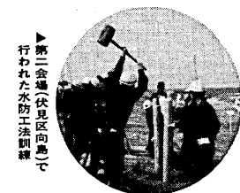
▼倒壊家屋から負傷者を救出(倒壊家屋救出訓練)