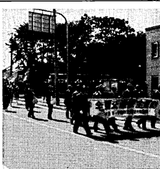
▲府警音楽隊による交通安全パレード(昨年9月、宇治市役所前)

市では、交通安全対策協議会を中心に、次の三つを目標に運動を進めています。 ①シートベルトの正しい着用 ②若年運転者の交通事故防止 ③歩行者及び自転車利用者の交通事故防止 更なる推進を行います。交通安全早期啓蒙。