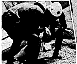
▲迫真のビル火災救助訓練