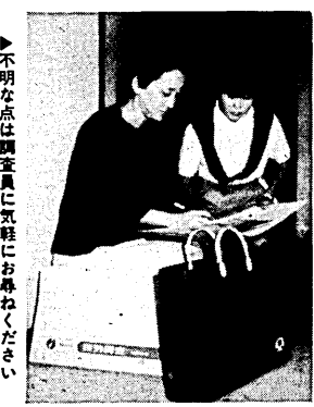
不明な点は調査員に気軽に尋ねてください

発行 京都府宇治市 編集 広報課 〒611 京都府宇治市 宇治民権33番地 電話 (0774)22-3141 ●毎月1日・11日・21日発行