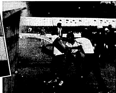
▲子どもたちもバケツリレーに備前初期消火訓練

去る九月四日、大陰が丘と伏見向島の二の会場で京都府総合防災訓練が行われ、四千人の各関係機関の職員や市民が参加、緊迫感の漂う中、いざという場合に備え三十二項目の訓練が繰り返されました。