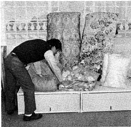
▲羽毛ふとんの品質は、手で押えて復元力を比べる方法で確認できる。

なにかにもあります。水鳥の羽は、しなやかで、ついで、空気を抱きこみ、かさが増えます。これら、エサで