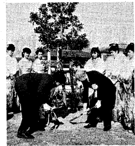
▲ことしも、2,548人の新成人が誕生。(1月15日、宇治市成人式での記念植樹)

自営業などの方は、必ず加入を 成人を迎えられた皆さん、おめでとうございます。これから、成人としての多くの権利と義務が生じます。国民年金は加入する義務があります。国民年金は、農業、商業、商業などの自営業、自由業の人やその家族で、厚生年金や共済組合などの年金制度に加 入していない17歳から19歳までの人が加入する年金制度です。20歳の誕生日を迎えたら、忘れずに国民年金に加入しましょう。国民年金は強制加入で、任意加入ではありません。加入の手続きは印鑑を持って、保険料を納めるのは、保険料を納めるのは、