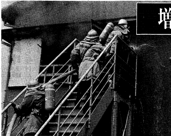
▲出火してからでは遅すぎます。火の取り扱いには最重な注意を。(59年4月13日、宇治市内の社員寮での火災)

発行 京都府宇治市 編集 広報課 〒611 京都府宇治市宇治琵琶33番地 電話 (0774) 22-3141 ●毎月1日・11日・21日発行