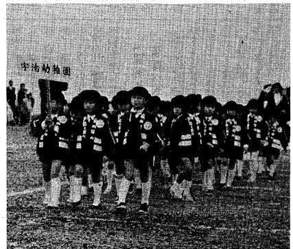
▶園児たちも力強く分列行進

まっています。出動内容は、急病千九百九十七件で五十八年比は六十九件の減。次に交通事故が八百七十七件で四十九件の増。交通事故が急増したのは、本市の都市化傾向を背景とするもので、急病が急増したのは、休日急診診療所の医療体制が市民浸透し、自家用車がタラシで搬送するケースが増えたことと理由と考えられます。