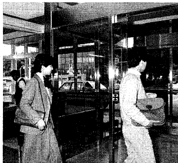
明るくなった新しい顔の庁舎玄関

市では、庁舎玄関を自動ドア化するの工事を行ってまいりましたが、十月十日に完成し、十七日から利用可能です。