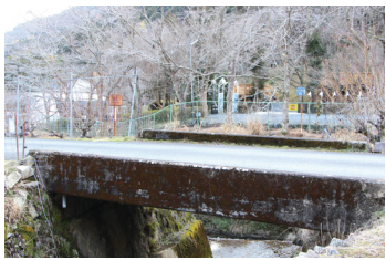
西笠取にある現在の巡礼橋