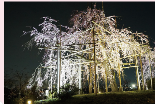
▲植物公園の夜間公開時のしだれ桜

開花状況は公式ツイッターなどで随時お知らせします。 時3月21日(祝)～31日(金)◎月～木曜日 午後5時～8時◎金～日曜日・祝日 午後5時半～9時 ※開園日は午後5時に一度閉園します。 ※月曜日は休園日のため、午前9時～午後5時半は入園出来ません。