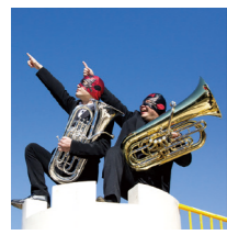
チューバマンショー

4月1日(土)午後1時〜開場は午後0時半) 所 同センター 小ホール 内 ユーフォニアムとチューバ