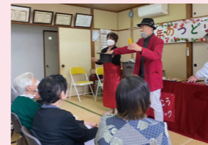
▲地域のつながりを作る催し