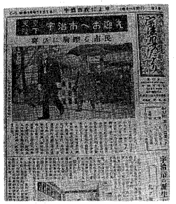
▲昭和26年12月1日発行の創刊号(表紙)

市民と市を結ぶパイプ役「宇治市政だより」が、今号で発行八百号を迎えました。昭和二十三年三月一日に市制が施行され、同年十二月一日、第一号を発行。その中で、「市の施策について、正しい事柄を周知徹底し、もって市政に対する市民の理解と協力を頂くため」を目的として、市民と市を結ぶパイプ役として、市民の暮らしや市政の動きを伝える役割を担っています。第一号の発行に、今号、親しまれ、読みやすさを追求し、内容を充実させてまいりたいと考えています。(広報課)