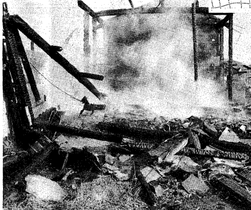
▲一瞬の内に大切な家財が灰に(昨年発生した民家火災)