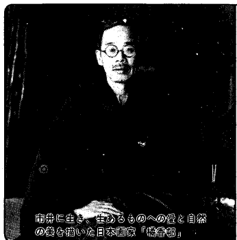
市街に生息、生かすものへの愛と自然の美を備えた日本画家『橘香亭』