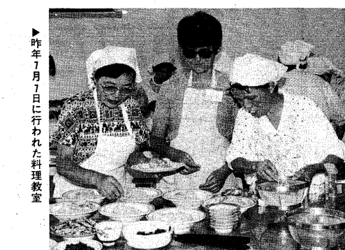
▶昨年7月7日に行われた料理教室

申し込みは、市民教育委員会(市立図書館)まで、お申し込みください。 ■申し込み期間：2月10日(月)から2月16日(日)まで、午後5時から午後9時30分まで、市民教育委員会2階大会室(市立図書館)にて、お申し込みください。 ■お申し込み先：市民教育委員会(市立図書館)2階大会室、電話：074-231-1111