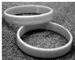
認知症あんしんサポーターの目印「オレンジリング」

認知症になっても安心して暮らすことのできる町をつくるため、認知症あんしんサポーター(認知症を正しく理解し、自分のできる範囲で認知症の人やその家族を見守り、応援する人)を一人でも多く増やそうとする運動が全国で広がっています。そこで市では、同サポーターを養成する「認知症あんしんサポーター養成講座」を行います。10人程度の人が集まって申し込みむと、あなたの住んでいる地域に講師が出向き、ご指定いただいた会場で講座を行います。お気軽に申し込んでください。なお、受講者には認知症あんしんサポーターの目印「オレンジリング」