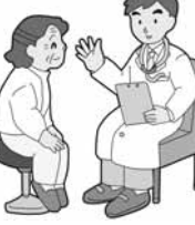
問 国民健康保険課

今年度から、今まで市が行っていた「基本(介護予防)健康診査」にかわり、40歳以上75歳未満の人は、加入している各医療保険の保険者が行う「特定健康診査」・「特定保健指導」を受けることになりました。これは、メタボリックシンドローム(内臓脂肪症候群)に着目した健診を行い、その結果を踏まえて、正しい生活習慣の指導などを行うものです。市国民健康保険(国保)