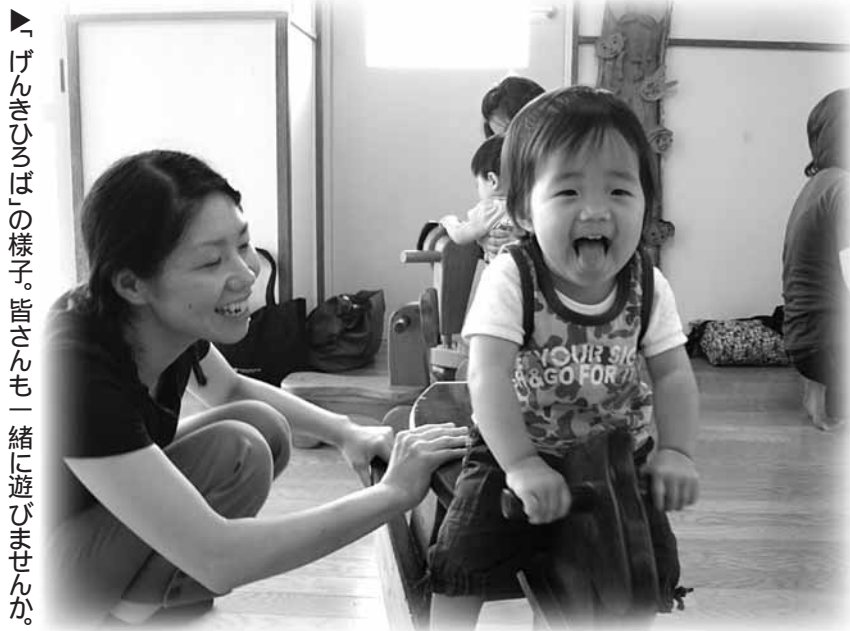
▶「げんきひろば」の様子。皆さんも一緒に遊びませんか。

♡申し込み...こども福祉課へ。なお、子どもの体調不良のときは、利用をお断りする場合があります。