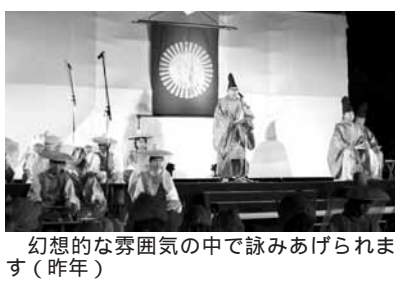
幻想的な雰囲気の中で詠みあげられます(昨年)

◆応募方法: 短歌・住所・氏名・電話番号を書き、 //www.wao.or.jp/denga.htm)を閲覧ください。 ◆形式: 短歌調(5・7・5・7・7)のもの