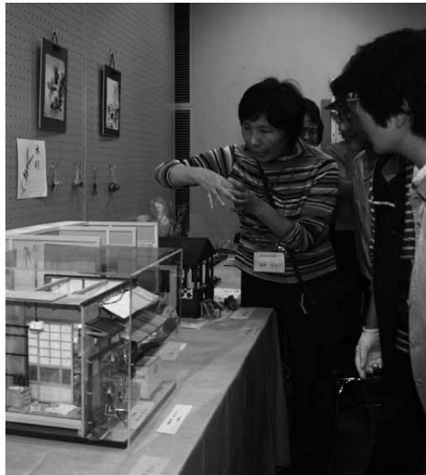
▲自身の作品の説明をする出品者と熱心に聞き入る来場者(昨年の様子)

◆とき…ところ・内容…次のとおり。いずれも文化センター。 ▲11月1日(土)◎午前9時50分～11時 吟詠・民謡(大ホール)◎午前10時～11時 舞(小ホール) ▲11月2日(日)◎午前9時～10時 洋舞(大ホール)