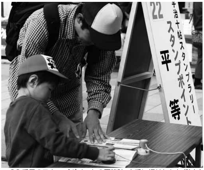
▲22番目のスタンプポイントの平等院。上手に押せたかな(昨年)

発行 宇治市 編集 広報課 ☎611-8501 宇治市宇治琵琶33 ☎ 22-3141 (代表) FAX 20-8779 ホームページ http://www.city.uji.kyoto.jp/ 携帯 http://m.city.uji.kyoto.jp テレホサービス ☎ 20-8777