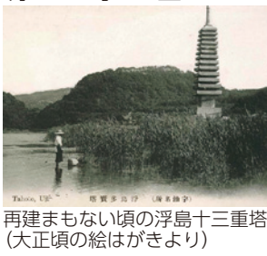
再建まもない頃の浮島十三重塔(大正頃の絵はがきより)

この夜はかなり冷え込んだようので、翌朝見物に出かけると「宇治橋は雪の様な霜」で覆われており、「ザクリザクリ下駄の二の字のあとをつけて渡ります。興聖寺を訪れたあと、帰りは船頭のすすめるままに渡し舟で宇治川を渡ります。蘆花は船頭に「あの塔は何かね、先(せん)には見かけなかった様だね」と尋ね、船頭は「近頃掘り出したんです。宝塔たら云ふてナ、あんたはん」と答えます。「みづのたはごと」所収「旅日記から」より)