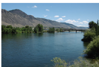
▶カムループス市の様子