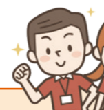
生活支援コーディネーター