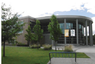
▶トンプソン・リバーズ大学の様子

《応募資格》市内在住で、次のいずれかに該当する30歳以下の人◎5年5月1日時点で大学、大学院、専門学校に在籍または在籍見込み◎5年3月時点で大学、大学院、専門学校を卒業・修了(見込みを含む)後2年以内※自費留学生は年齢制限なし 《募集人数》◎留学生奨学生12人 ◎自費留学生11若千名 《留学期間》5年5月1日～8月31日 ④◎留学生奨学生11授業料・生徒会費・出願料免除※渡航費用、滞在費等は個人負担 ④◎自費留学生11すべての経費は個人負担 ④募集要項を確認の上、必要書類を、11月29日(火)まで(必着)に、郵送か秘書広報課窓口へ。募集要項等は同課にあるほか、市ホームページから印刷出来ます。