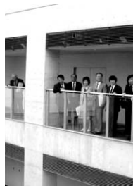
▲えーるピア久留米で