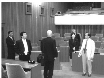
▲唐津市議会議場で