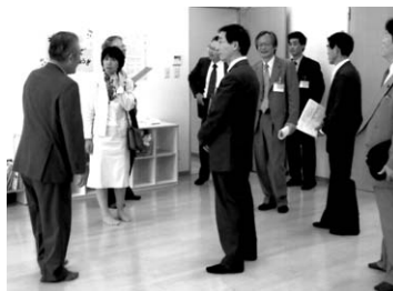
▲こどもセンターで

社会経験豊富な中高齢者を雇用し園児との世代間交流の促進を図る保育園土制度や、家庭での育児機能の補完を目的に24時間・年中無休で開園されているファミリーヘルプ保育園などの子育て支援施策について説明を受けました。