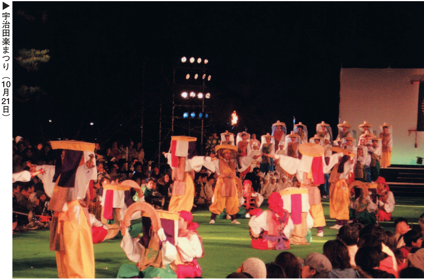
宇治田楽まつり（10月21日）

10月10日に開かれた議会運営委員会で12月定例会の日程が内定されました。正式日程は11月30日に予定されています。議会運営委員会で決定されますので、事情により変更される場合があります。