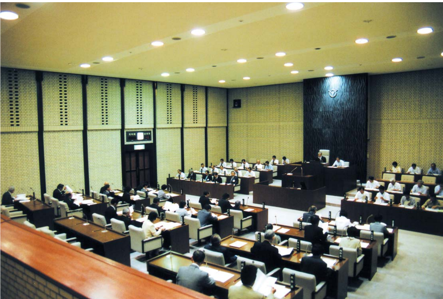
6月定例会議場風景

平成19年6月定例会は、6月13日から7月3日までの21日間の会期で開かれました。