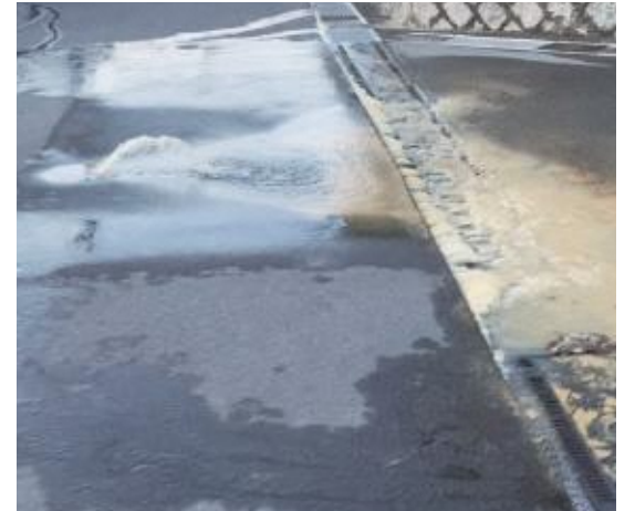
「水道管の老朽化による漏水」