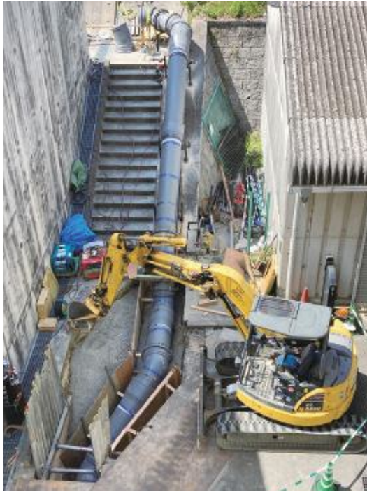
「配水管工事の様子」

しかし、人口の減少や、節水型機器の普及による節水意識の高まりにより、水道料金収入は減少傾向にあります。今後、水道料金収入は毎年減少し、10年後には現在と比べて約3億円減収する見込みです。