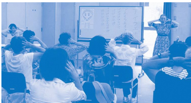
アンチエイジング講座 (生涯学習センター)

足腰の筋肉と同様に、顔周りの運動や歌など、ストレッチの時間を意識的に増やすことで、口腔周囲の筋肉を鍛える事ができます。