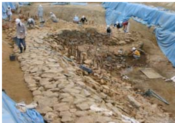
石積み護岸と石出し

このため本市では、この遺跡の保存・活用を図るとともに、観光宇治の新たな拠点として整備するため、関係地権者の皆さんとも協議を重ね、土地区画整理事業の大幅な計画変更にご協力いただくこととなりました。