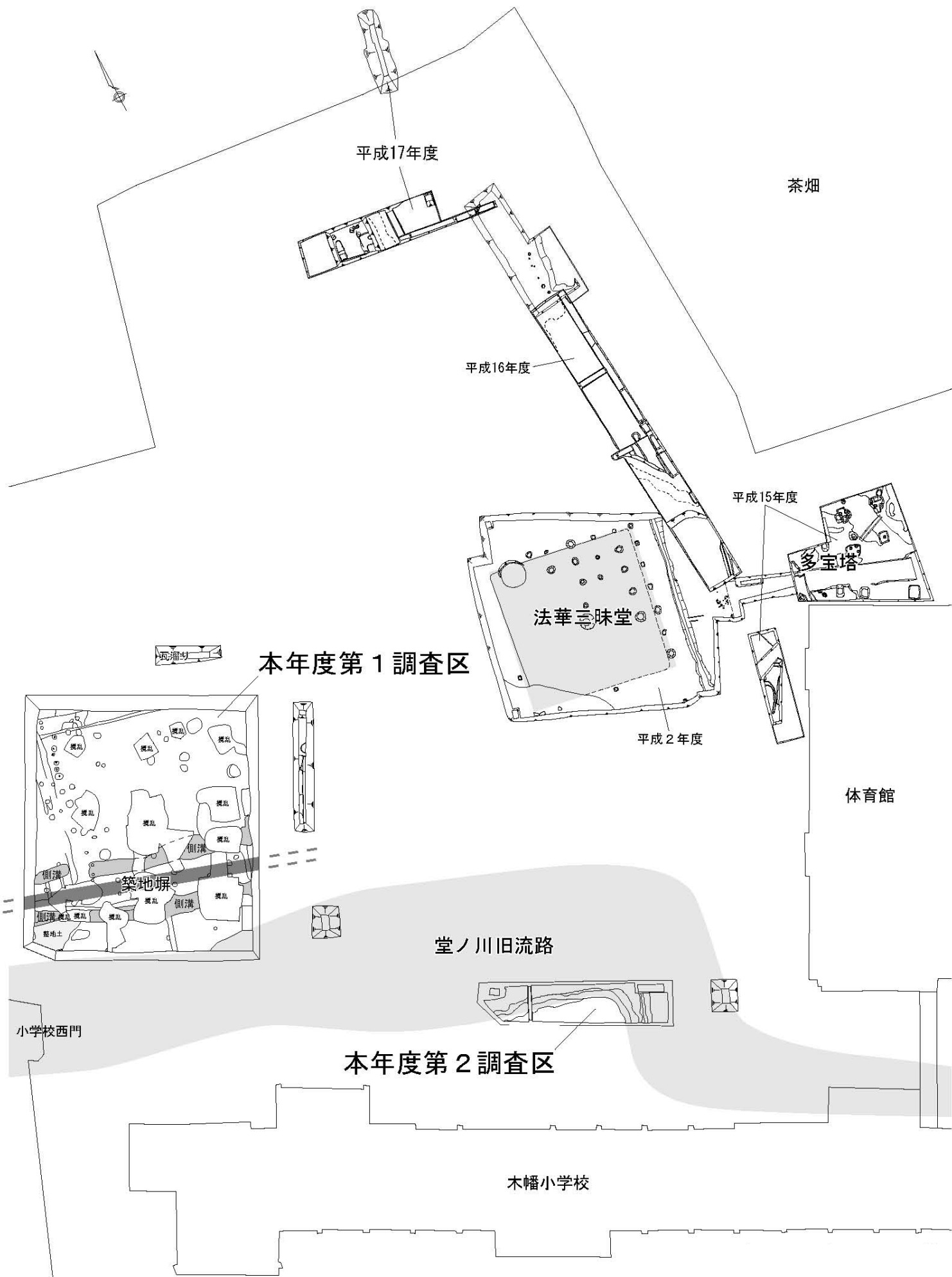
第1図 浄妙寺跡調査区配置図