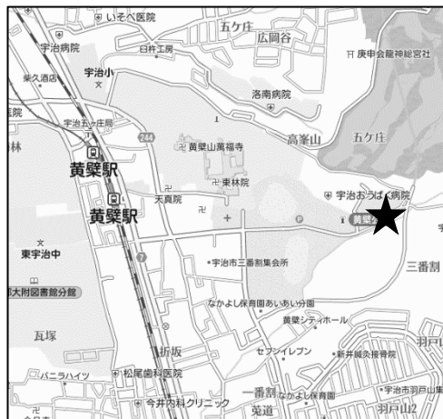
黄檗体育館 (五ヶ庄三番割 25-1)

※メール送信後、3日以内に受付確認の返信が届かない場合は、下記までお電話ください。