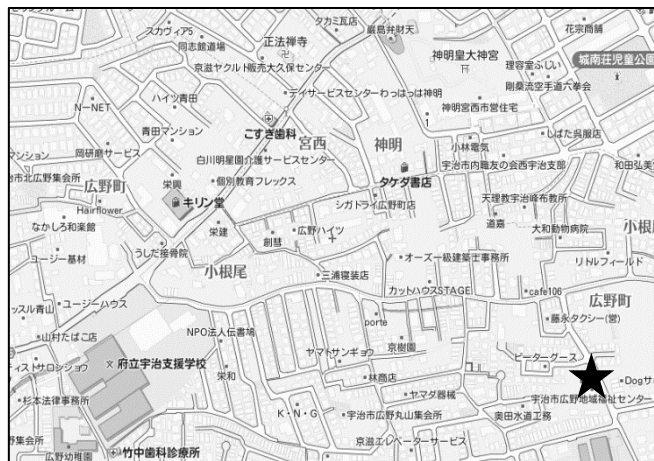
広野地域福祉センター (広野町大開 72-1)