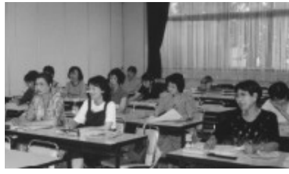
ユニークな企画をお待ちしています

政治活動や宗教活動、営利活動を目的としない 事業の実施期間：7月1日(土)～13年3月15日(木) 申し込み・問い合わせ：市指定の申請書に必要事項を記入し、5月25日(木)までに女性政策室(〒611 850 1住所省略可)☎20・8769(へ)郵送か持参してください。申請書は同室にあります。