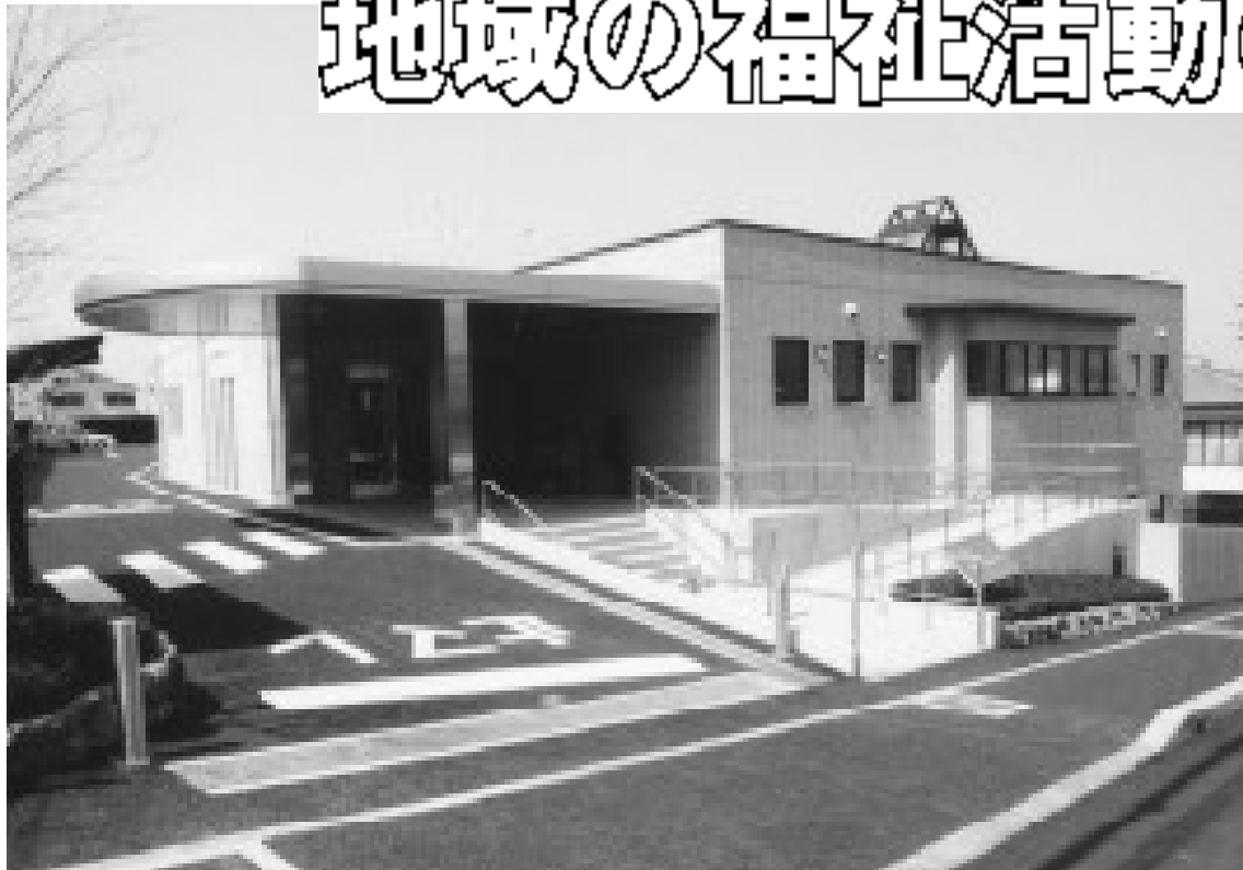
4月13日(木)に竣工式が行われる広野地域福祉センター(3月27日撮影)