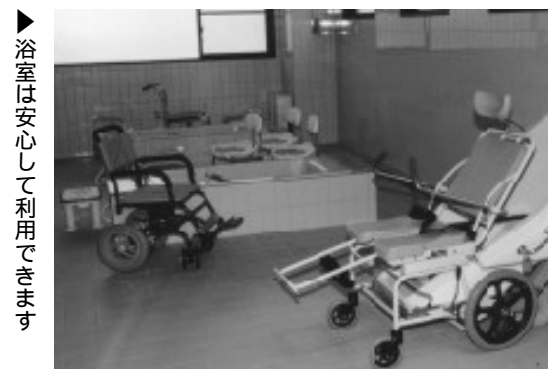
浴室は安心して利用できます

このほかにも、社会福祉関係団体の人に活動していただく、介護者教育室や会議室などがあります。福祉活動の拠点としてご活用ください。