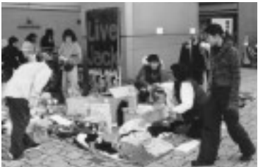
たくさんの人でにぎわったフリーマーケット(今年3月)

・氏名・年齢・電話番号・自己PRを書いて文化自治振興課(☎内線2223、FAX 21・0408)へ。受付後、実行委員会の案内状をお送りします。