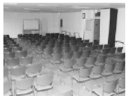
ホームヘルパーの育成や講演会ができます

浴室(男子・女子)：利用日・時間は月～金曜(祝日、年末年始は除く)、午後1時～3時(男女交代) 申し込み方法：4月14日(金)から同センターの事務所で(要印鑑)。最初の申請時に「地域福祉センター利用証」を交付します。