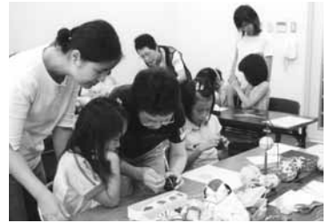
昨年の夏休み子どもフェアの様子

出展日時：7月24日(火)・25日(水)（いずれも午前10時～午後3時）のうち、次の(ア)～(ウ)の日程を選択してください。(ア)両日の全日 (イ)いずれかの日の全日 (ウ)いずれかの日の半日(午前・午後)