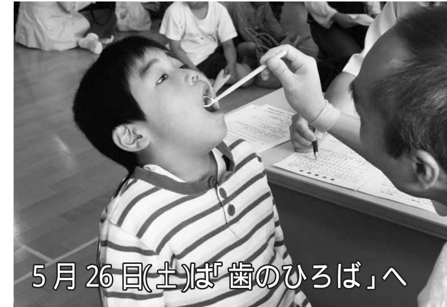
5月26日(土)は「歯のひろば」へ