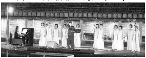
昨年のたそがれサマーコンサート

8月3日(金)・4日(土)・5日(日) 午後9時半まで開園(入園は午後9時まで)