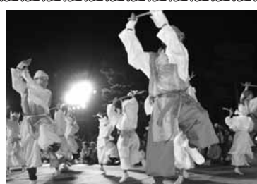
昨年の田楽まつりの様子

宇治田楽まつりとは、 市民のみなさんが中心と なり、宇治に伝わる伝統 的な芸能「田楽」を、現 代に復活させたまつりで す。