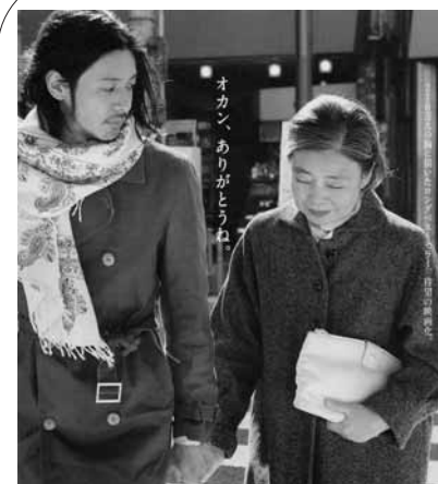
亡き母への思いを綴りベストセラーとなった、同名自伝小説の映画化。

3講の施設見学＝午後1時10分に市役所議会棟南側へ集合後、市のバスで移動。午後3時50分ごろ戻ります。