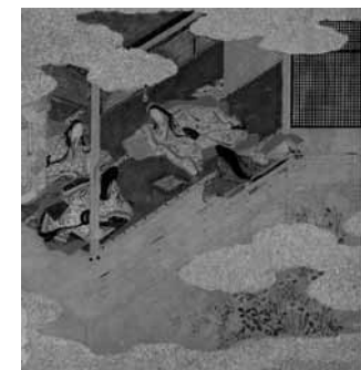
源氏物語ミュージアム所蔵 伝土佐光則筆「源氏絵鑑帖」より

の菓子ではないと知ると、左近少将は、常陸介の実の娘との結婚に乗り換えてしまいます。しかも結婚日時や場所も変えず、おまけに浮舟の父母が用意した婚禮調度までそのまま使ったのです。 中将の君は、浮舟の傷心を心配し、京の中、君に預けます。そこで浮舟を偶然見つけた句、宮は、浮舟の美しさに、中君の妹と知らずに言い寄ります。その場は、事なきをえましたが、心配した中将の君は浮舟を京の三条の家に移します。浮舟が三条の小家に引越したことを知った薫は、浮舟をどついたらよいか、思案します。