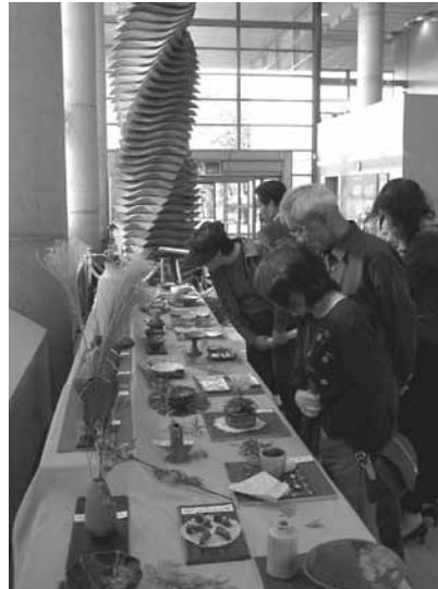
昨年の展示の部の様子