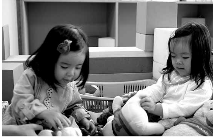
▲写真はイメージです。