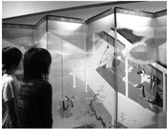
▲美しい屏風を見て、あなたも源氏物語の世界に親しんでみませんか。