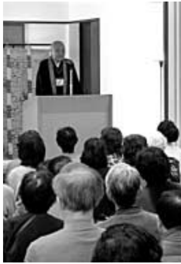
▲昨年の様子。毎年行われる、人気のある講座です。

定員：200人(応募多数の場合は抽選)受講料：1000円(当日徴収)応募方法：往復はがきに、住所・氏名・年齢・電話番号を書き、12月25日(月)まで(必着)に、源氏物語ミュージアム(〒611-0021宇治東内45-26、☎39-9300)へ。はがき1枚に1人のみ(複数枚の申し込みは不可)。