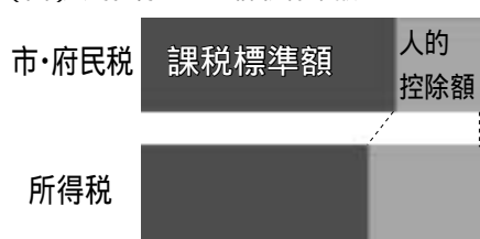
(図)人的控除の差と課税標準額のイメージ