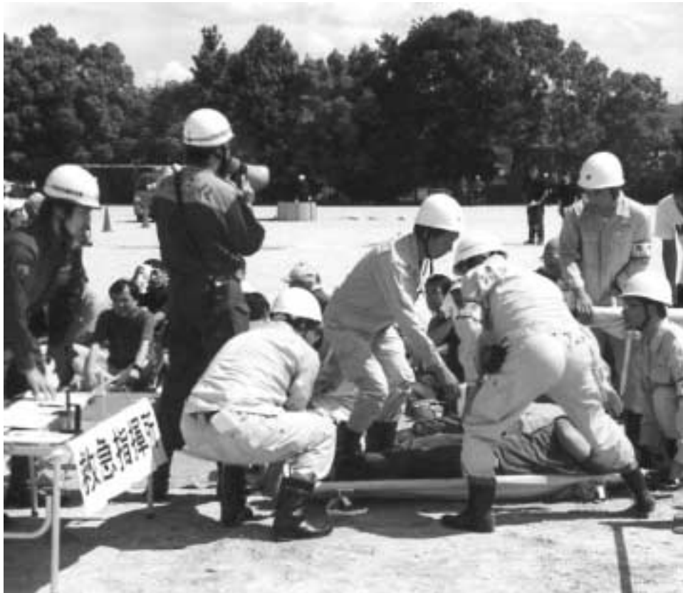
昨年の防災訓練の様子