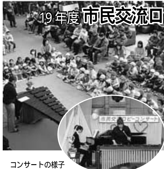
コンサートの様子

市では、市民の皆さんが気軽に音楽を楽しみ、また、音楽活動の成果を発表できる場として、市役所1階の「市民交流ロビー」を会場としてコンサートを開いています。これまで合唱、ピアノ、バイオリンなど、さまざまな発表がされてきました。