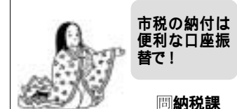
市税の納付は便利な口座振替で! 納税課