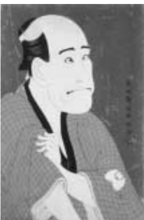
東洲斎写楽「嵐籠蔵の金貨石部金吉」