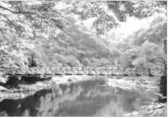
▶推薦・初宇治市観 光協会賞 新緑の 天ヶ瀬 齋藤誠