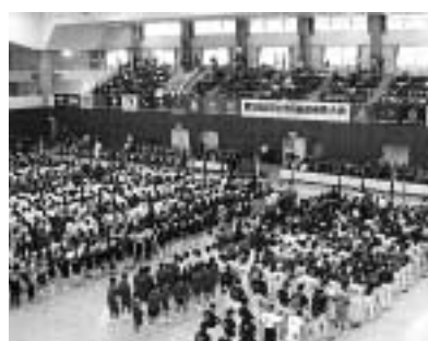
▲昨年の総合開会式

第39回市民総合体育大会が5月8日(日)から開幕します。25競技に市民の皆さんが技と力を競います。この大会は市民のスポーツ振興と余暇の有効活用、健康づくりを目的に行うものです。競技日程は左表のとおり。あなたも参加してみませんか。