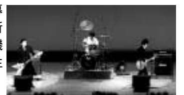
昨年度は「20歳のステージ」と題して5組が出演(写真はバンド演奏)また、中学生時代の恩師のビデオレター上映などを行いました。

新成人になる皆さんの積極的なご応募をお待ちしています。活動内容...成人式(特に特別企画)の企画・準備・当日の運営。月に数回(基本的に平日夜間)会議を行います。対象...平成18年成人式対象者(昭和60年4月2日~昭和61年4月1日生まれで、本市に住民登録・外国人登録のある人)募集人数...15人程度 応募方法...6月30日(木)までに 氏名 住所 生年月日 電話番号 簡単な応募動機を書き、郵便・ファクス・Eメールで生涯学習課 〒611-8501 <住所省略>、FAX 21-0400、shogaigakushuka@city.uji.kyoto.jp <携帯からも可>。市ホームページ(生涯学習課のページを利用)からも応募できます。