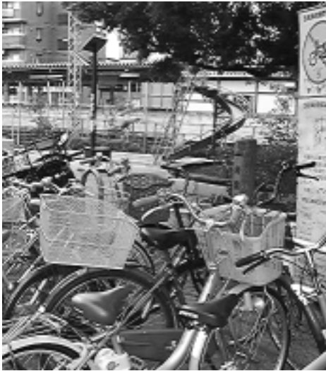
自分だけなら大丈夫と思っていませんか 迷惑駐車が事故を招くことも...