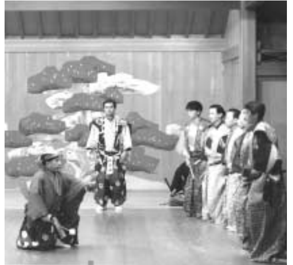
茂山狂言会 公演の一場面