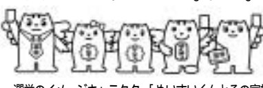
選挙のイメージキャラクター「めいすいくんとその家族」