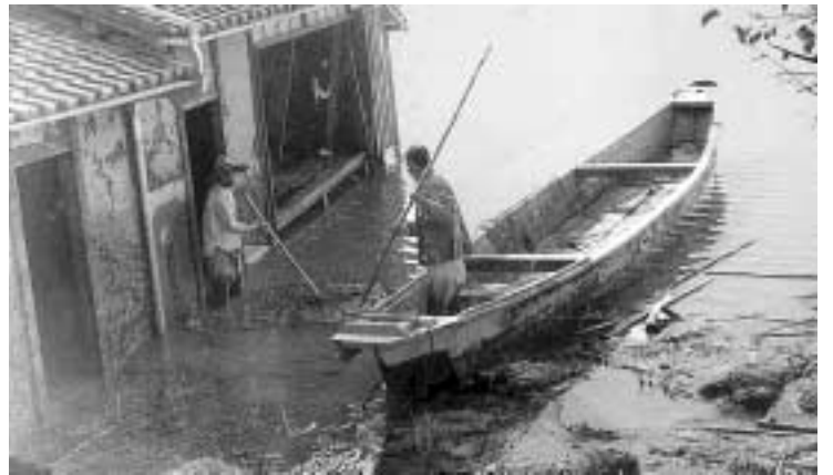
▲昭和28年9月25日に発生した宇治川大洪水(横島町落合)

止めることも、地震がいつどこで起きるのかを正確に予知することもできません。いつ発生しても被害を最小限に抑えられよう、私たち一人ひとりが、地域で家庭で防災対策をしっかりと行い、防災力を高めておくことが大切です。