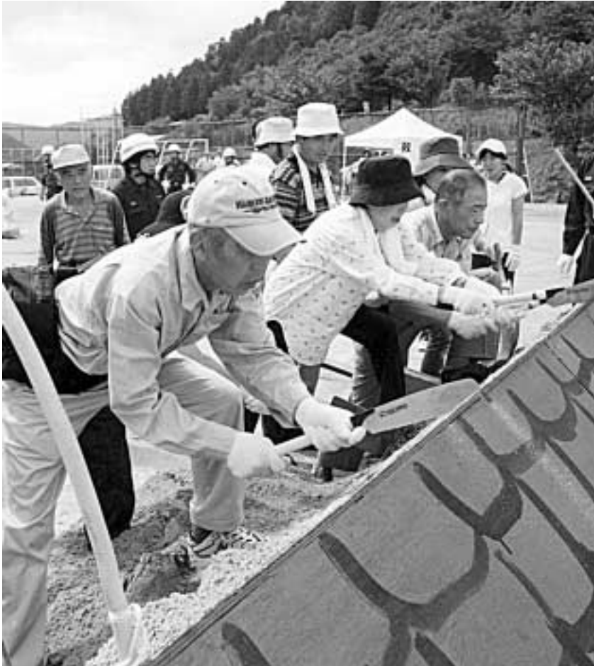
▲昨年、笠取小学校で行われた防災訓練の様子

約100年間隔で発生している、和歌山沖などを震源地とする東南海・南海地震が20～30年後には、ほぼ確実に発生すると言われております。また、これらの地震の前には内陸直下型の地震が多発する活動期があるとされ、11年前の兵庫県南部地震から日本列島はこの活動期に入ったと言われております。その後、鳥取県西部地震、芸予地震や福岡県西方沖地震、また、新潟県中越地震など、大きな地震が各地で多発して