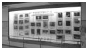
ギャラリーの展示は出品者自身が行います

<募集数> 19コマ(多数の場合は抽選) <展示料> 無料 詳しくは、市公共施設にあるチラシをご覧ください。