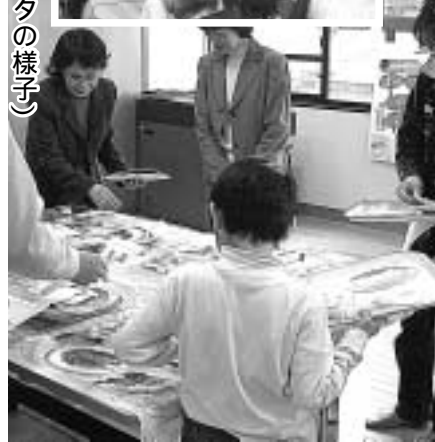
(昨年のフェスタの様子)

「宇治市健康づくり推進プラン(平成14年12月に策定)を進めるために市が設立した市民による団体「うー茶ん連絡会」と市が、力を合わせて行います。