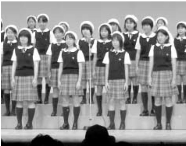
▲敬老会での発表の様子(文化センター大ホール)。普段の練習はいつでも見学できます。

宇治市少年少女合唱団では、現在、小学3年生から中学3年生までの約70人が団員として活動しています。団員は、定期演奏会や各種発表会、行事での演奏をはじめ、合宿やクリスマス会などさまざまな活動を行っています。また、練習は、毎週土曜日の午後2時から4時半まで、主に宇治公民館で行っています。 市では、4月から一緒に活動する団員を募集します。歌や音楽が好きな人、一緒に歌いませんか。 対象 ：4月に小学3~6年生・中学1年生になる市内在住の小学生 募集期間 ：2月13日(月)~3月17日(金) 申し込み ：文化自治振興課や市内の各公民館・コミュニティセンターなどにある申込書に必要事項を書いて、郵送・ファクス・持参のいずれかで文化自治振興課(〒611-8501住所省略可、FAX 21-0408)へ。 なお、期間後も随時受け付けますので、同課へお問い合わせください。