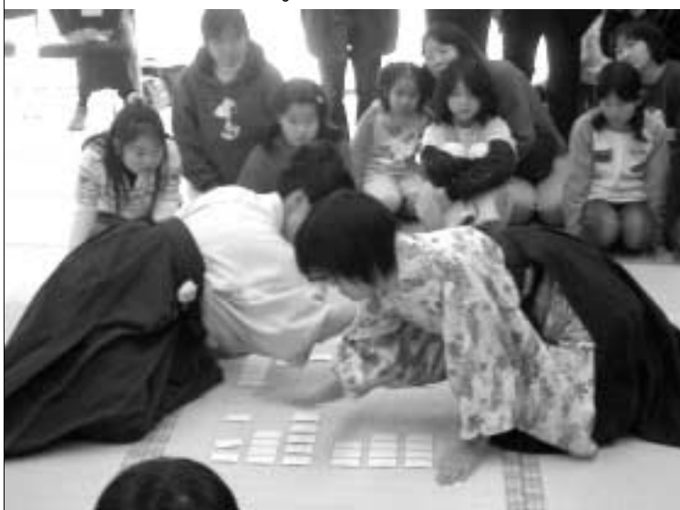
▲昨年の模範試合の様子

成者が用意した紙で当日作成 ▼参加費：200円 ▼申し込み：いずれも当日に直接会場へ。紙ひこうきの販売もしています。 ▼問い合わせ：生涯学習センター