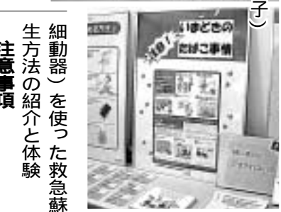
(昨年のフェスタの様子)