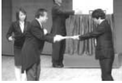
▶ 昨年の贈呈式の様子

左記の要領で、作品を文化自治振興課(〒611-8501住所省略可)へ、郵送か持参してください(土・日曜、祝日は除く)。なお、作品は1人(1グループ)1点に限り、Eメールでの応募も受け付けますが、その場合は事前に電話でお問い合わせください。(bunkajichi@city.uji.kyoto.jp)