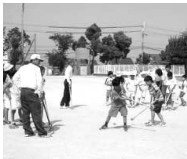
▲子どもの自由な発想で遊べる活動をお待ちしています

地域が一体となった取り組みであること。地域の独自性を取り入れた取り組みであること。今後の継続性・発展性が強く期待される取り組みであること。 提案書の提出: 5月31日(月)までに、生涯学習課または生涯スポーツ課へ直接提出 選定方法: 提案された活動の中から、最大7つの活動(地域)を選定します。選定された活動(地域)には、8万円を上限に、その経費の一部を教育委員会が負担します。