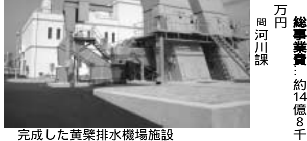
完成した黄檗排水機場施設

黄檗排水区整備事業は、五ヶ庄地域の浸水被害対策として、昭和56年度から事業着手しています。京都大学構内から黄檗山万福寺正門前に至る上流部は、都市下水路事業として、平成2年度に完成しました。