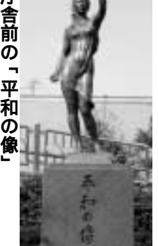
市庁舎前の「平和の像」

宇治市平和都市推進協議会と市では、市民の平和への思いを込め、「(仮称)平和の鐘」を市庁舎前に建設し、その響きを世界の人々に発信したいと願っています。市民の皆さんには、この趣旨をご理解いただき、募金へのご協力をお願いいたします。併せて、この鐘が市民の皆さんに親しまれるよう、名称を募集します。 問総務課 世界の恒久平和と核兵器の廃絶は人類共通の永遠の願いです。 市では、昭和62年に宇治市議会において、「核兵器廃絶平和都市宣言」が決議され、「核兵器による惨禍を決して繰り返さず平和を子々孫々に引き継ぐ」という理念に基づき、「平和の像」とともに、本市の平和のシンボルとして、その響きを世界の人々に発信したいと願っています。なお、今年度の平和祈念集会(8月