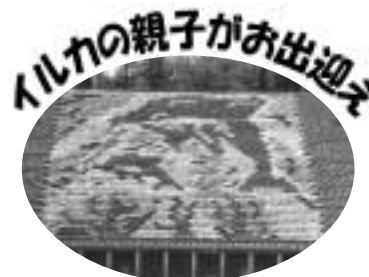
【第3回花と水のタペストリー 絵柄市民公募・宇治市長賞作品】

花と緑のフリーマーケット 園芸グループによる展示販売と体験教室 寄せ植え・ハンギングバスケット体験教室 花苗・鉢・ガーデニンググッズの販売 市内授産施設の展示販売 植物クイズ お茶席