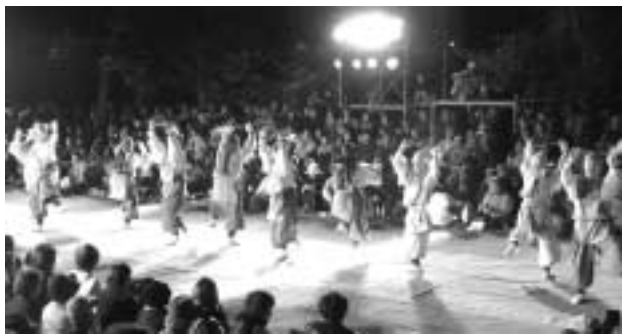
▲昨年の宇治田楽まつりの様子

(ふりがな)・年齢・生年月日・性別・身長・電話番号・勤務先とその電話番号または学校名・希望する種目を書き、5月29日(土)まで(必着)に、宇治田楽まつり実行委員会「出演者」募集係(〒611-0041 横島町吹前55-2 brio内)へ、 応募者説明会: 6月12日(土)、午後6時から生涯学習センターで行います。なお、応募の人数によっては、希望どおりの種目に出演で