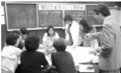
▲福祉のまちづくり懇談会の様子

福祉委員会・NPO団体などへのヒアリングやアンケート 多くの住民の参加による「福祉のまちづくり懇談会」などを